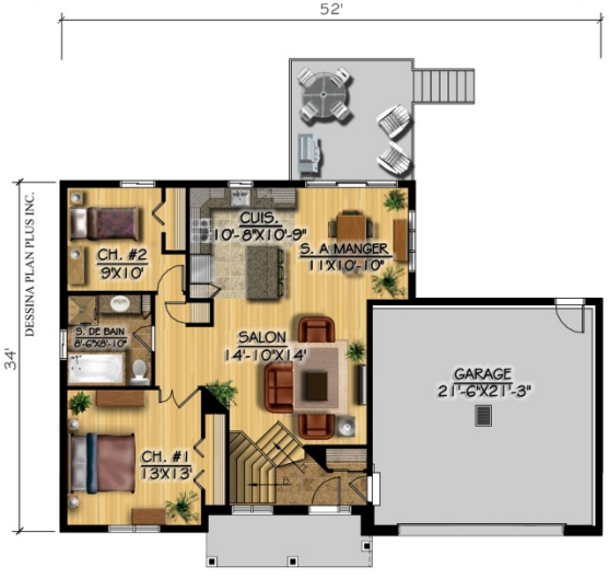
PLAN DU REZ-DE-CHAUSSEE SUP.: 1 022 pi.ca. + GARAGE: 505 pi.ca. A PARTIR DES MURS EXT.