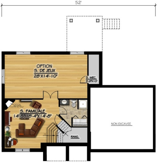
PLAN DU SOUS-SOL SUP.: 1 036 pi.ca.